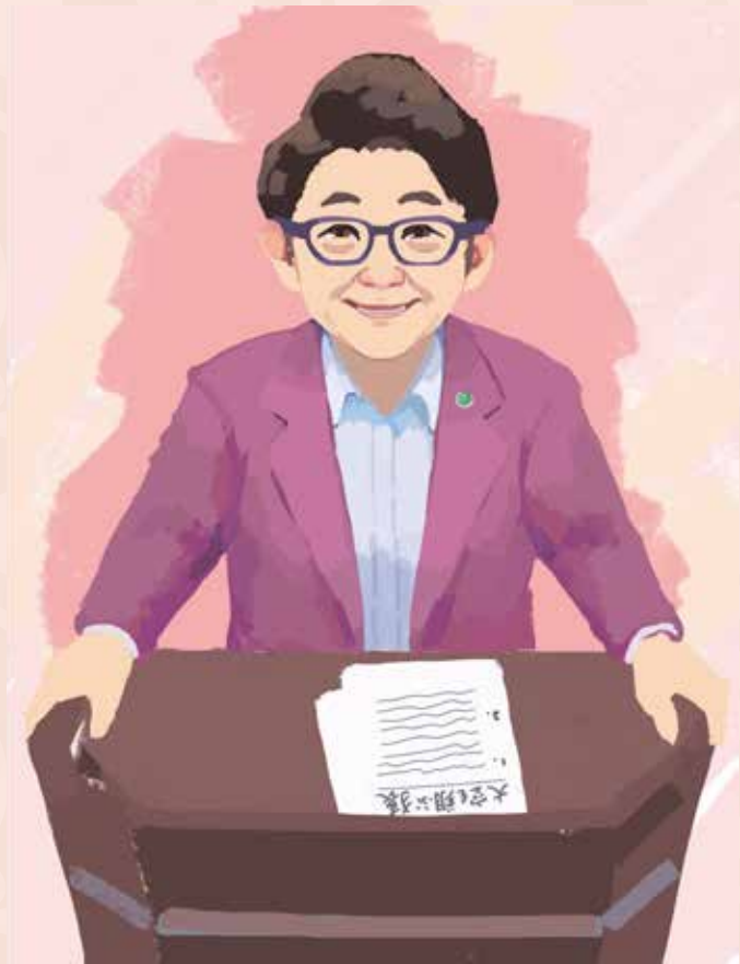
イラスト：遊馬大空(人間塾第10期生) デザイン：猿渡啓太(人間塾第9期生)